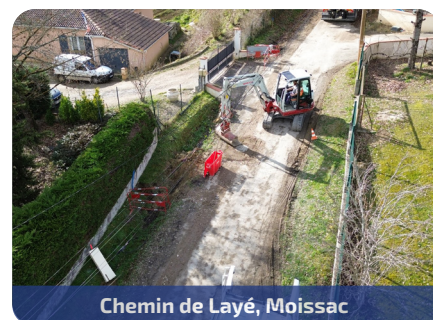
Chemin de Layé, Moissac

Travaux de renouvellement du réseau d'eau potable : > 1 500 mètres linéaires > 32 branchements > 18 semaines de travail > 282 000 € TTC