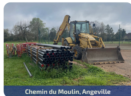
Chemin du Moulin, Angeville

Renouvellement du réseau alimentant le réservoir de Caumont par Angeville : > 900 mètres linéaires > 19 branchements > 10 semaines de travail > 122 760 € TTC