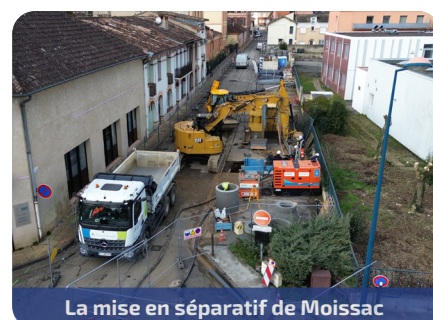
La mise en séparatif de Moissac

Mise en séparatif du secteur Collège de Moissac : > 5 000 mètres linéaires > 420 branchements > 36 mois de travail > 5 580 000 € TTC