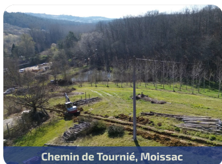
Chemin de Tournié, Moissac

Travaux de renouvellement du réseau d'eau potable : > 850 mètres linéaires > 5 branchements > 8 semaines de travail > 129 720 € TTC