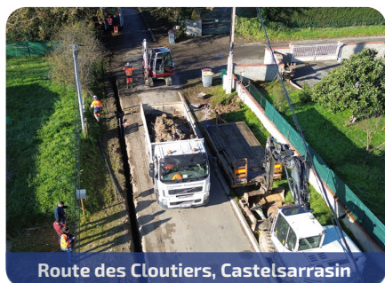
Route des Cloutiers, Castelsarrasin

Comme nous vous le présentions précédemment, le plan d'investissement du syndicat est très chargé pour les années à venir et 2025 ne déroge pas à la règle. De très nombreux chantiers ont été lancés sur l'ensemble de notre territoire en eau potable et assainissement :